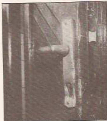
„Zárteltörés módszerével” (archív felvétel)

– A fiatalasszony meggyilkolása mindenkit megdöbbentet, szerencsére a pol-