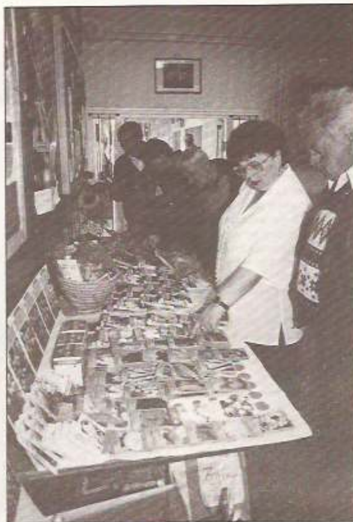
... és látható