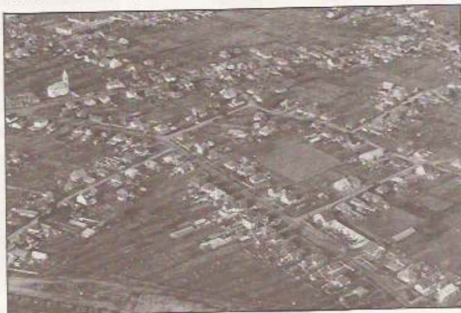
Madártávlatból nem látszik az ezernyi gond

A fentiekből remélhetőleg kiderült: a rendelkezésre álló, felhasználható pénzeszeget adott, az igényeket, elvárásokat ehhez kell igazítani. Természetes, hogy eközben bizonyos részérdek s sérülhetnek, mégoly