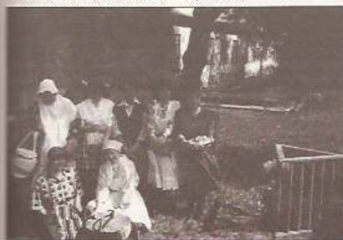
Óvónők a kulturális seregszemlén