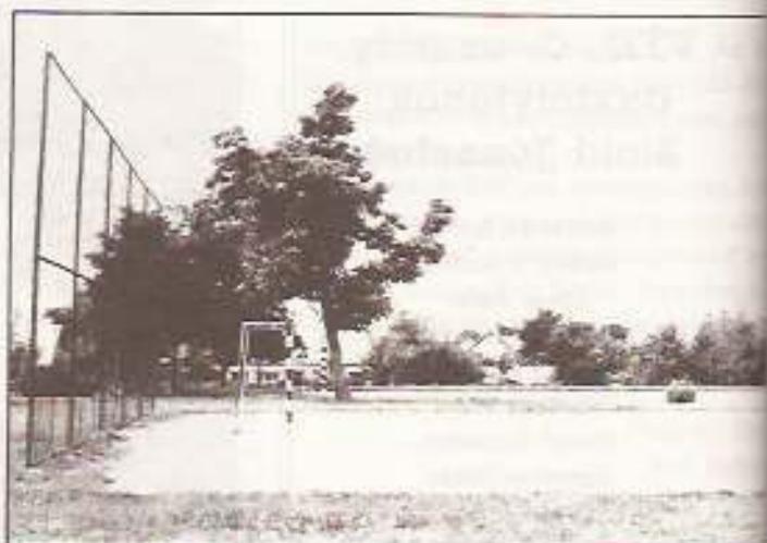
Sportudvar a központi iskolában