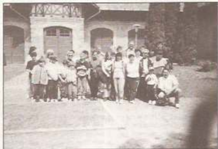
Kirándulás a jutalomból