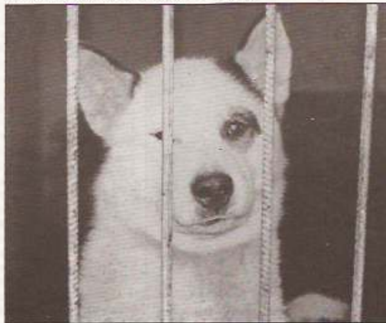
Állatotthon (felvételünk illusztráció – archív fotó)

(2) A gazdátlan, kóbor ebek befogásáról és a gyepteseteri telepre történő szállításáról a Nyíregyházi Városüzemeltetési KHT. gondoskodik. A rendeletben foglaltak megszegésével szemben a polgármesteri hivatal szabálysértési eljárást folytat le és bírságot szab ki.