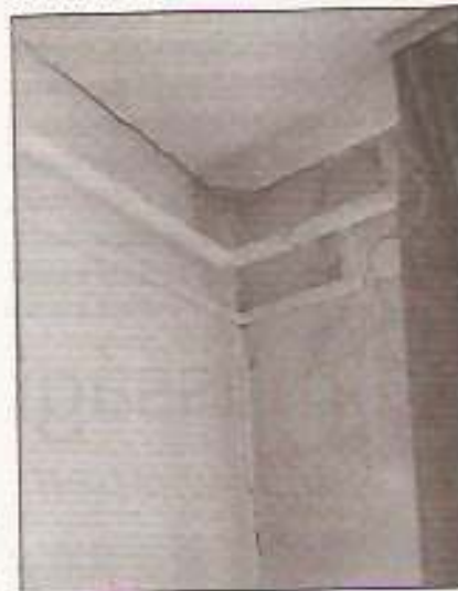
A rendőrség épülete megérett a felújításra