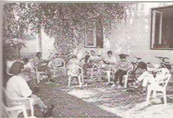
Képzünkön az TEL-INFO Kft. dolgozói

Több mint fél év után úgy tűnik végre sikerül egy 28 főt foglalkoztató kis üzemet beindítani településünkön.