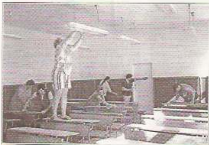
Képünkön az iskola tantermeit szépítik a takarító nének

Ez a nagytakarításban, tanteremszépítésben jelentkezik. A nyári felújítási munkák során a költségvetésből festő szakember részére csak 4 tanterem festését tudta az iskola fedezni. Ezt is csak úgy, hogy az előkészítő munkálatokat közhasznúak segítségével kellett megoldani.