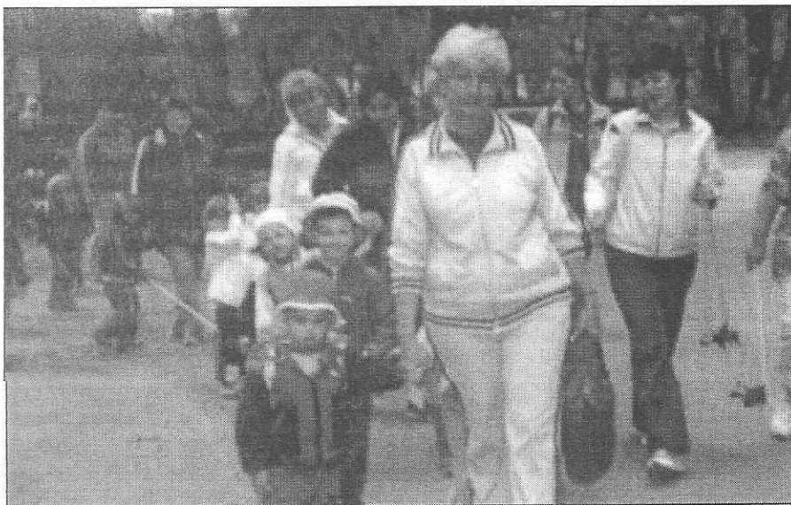
Kirándul az óvoda

„Amikor először jöttem óvodába Csak néztem, néztem félve szét A világért el nem engedtem Édesanyám kezét.”