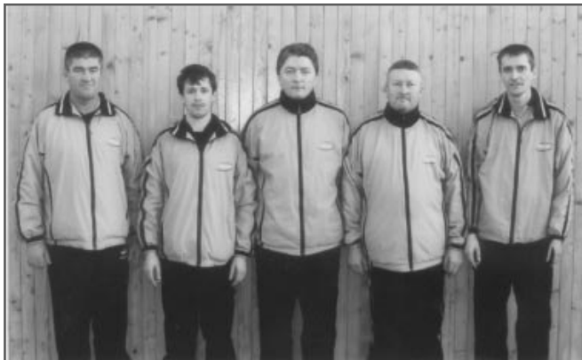
Geodézia-Német-Kemecse SE asztalitenisz Megyei I. o. bajnokcsapata 2004-2005

csapatunk megnyerte a megyei I.o. bajnokságot. Amikor betegségek és eltiltások nem akadályozták az összeállítást, nem v e s z t e t t ü n k mérkőzést.