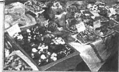
Valamennyi program szervezőinek, közreműködőinek köszönjük a munkáját!