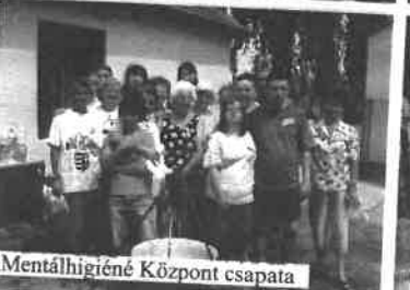
Mentálhigiéné Központ csapata