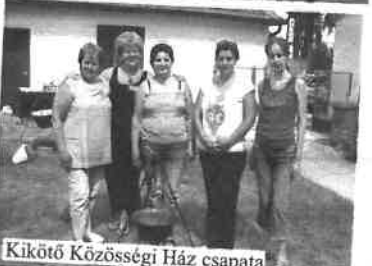
Kikötő Községi Ház csapata