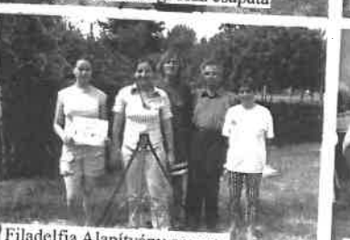
Filadelfia Alapítvány csapata