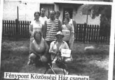
Fénypont Községi Ház csapata