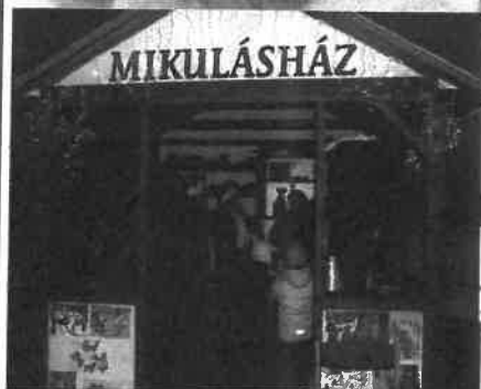
At elevenyől bézárta a képe

Ebben az évben is megrendezésre került a Mikulás város ünnepség, melyet téli hangulatban töltöttünk. Öröm számunkra, hogy a meghirdetett versenyeken több mint 100 gyerek szerepelt rajz, dal és szavlatok kategóriában. Minden versenyzőnek köszönjük a részvételét és reméljük, hogy jövőre is ugyan itt találkozunk.