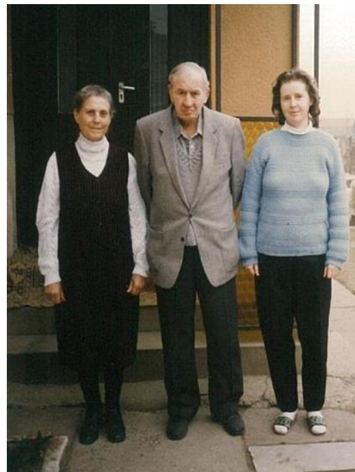
Kedves feleségével és Borika lányával