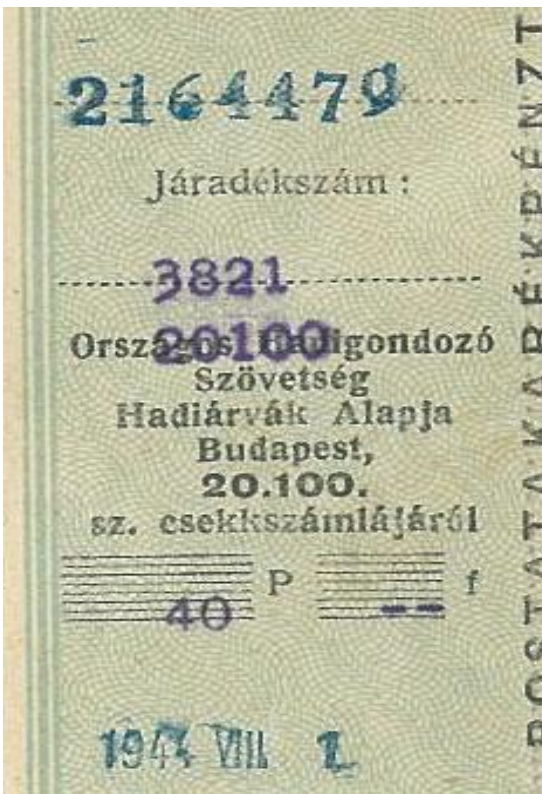
Bal oldali fotó: Hadiárva járadék (1944)