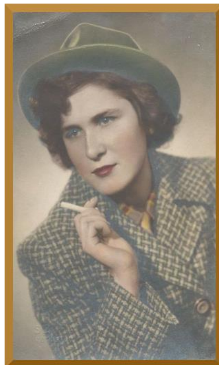
4. sz. kép