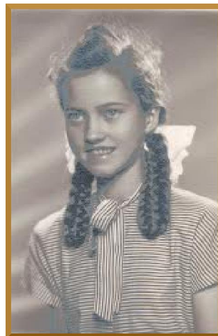
3. sz. kép