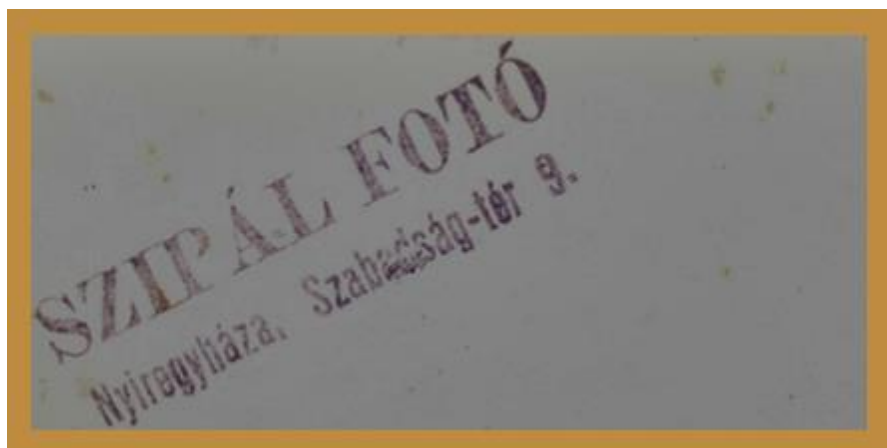
2. sz. kép