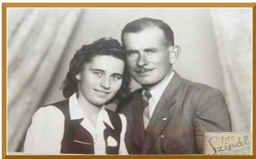
1. sz. kép