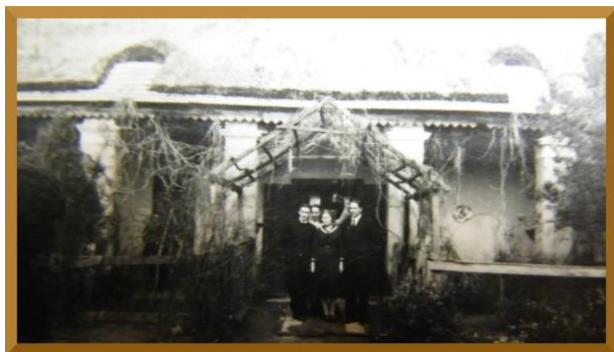
5. sz. kép