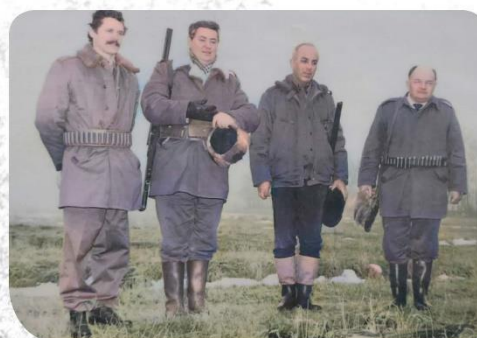
▲ Farkas Bertalan vadászaton