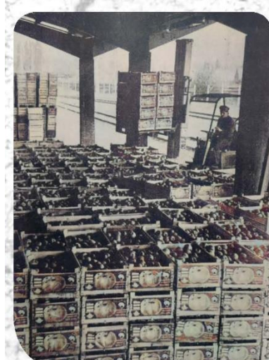
▲ Almatároló, almacsomagoló