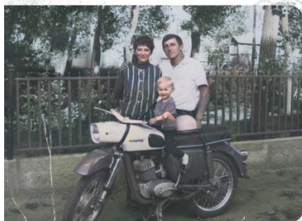
▲ Motor a családban