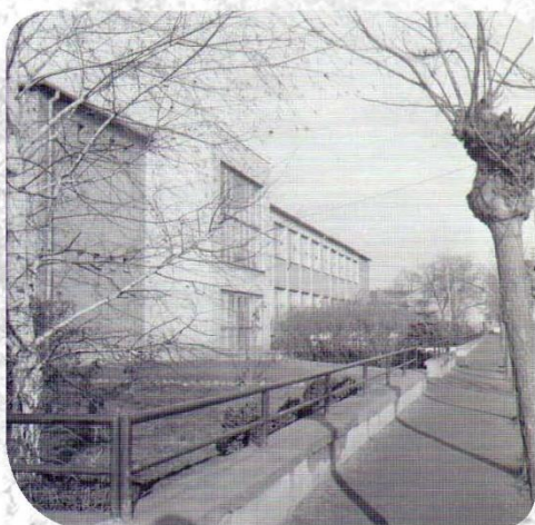
▲ Fényképnegatív a kemecei Arany János Általános Iskoláról