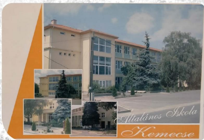
▲ Képeslap a kemecei Arany János Általános Iskoláról