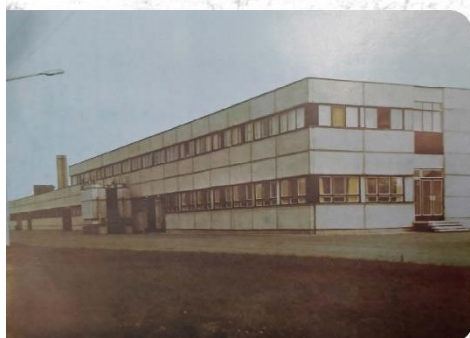
▲ Négy száz vagonos almátároló