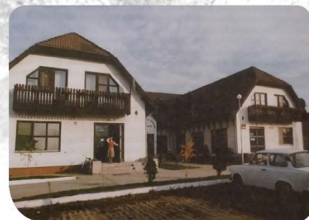
▲ Egészségügyi Központ