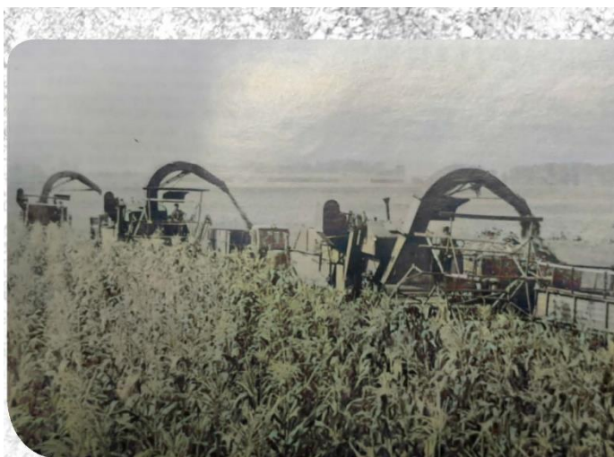
▲ Silózás, kukoricabetakarítás