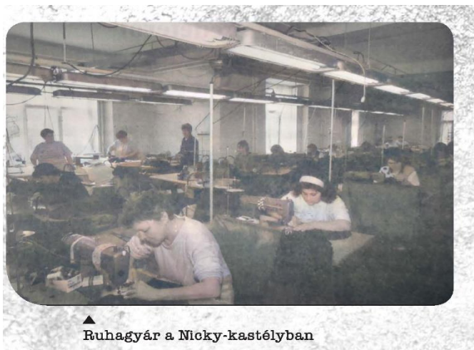
▲ Ruhagyár a Nicky-kastélyban