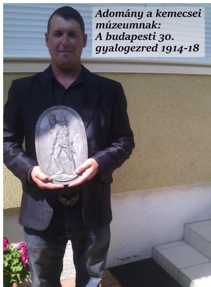
Adomány a kemecsei múzeumnak: A budapesti 30. gyalogezred 1914-18