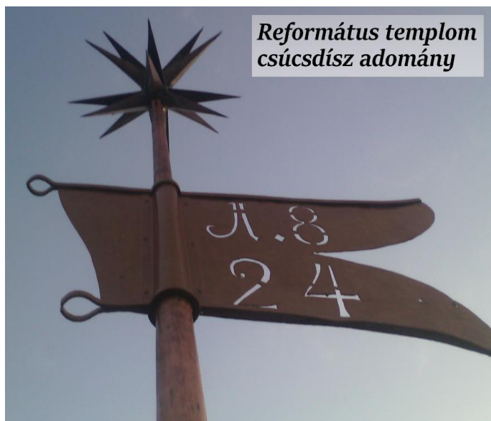
Református templom csúcsdísz adomány