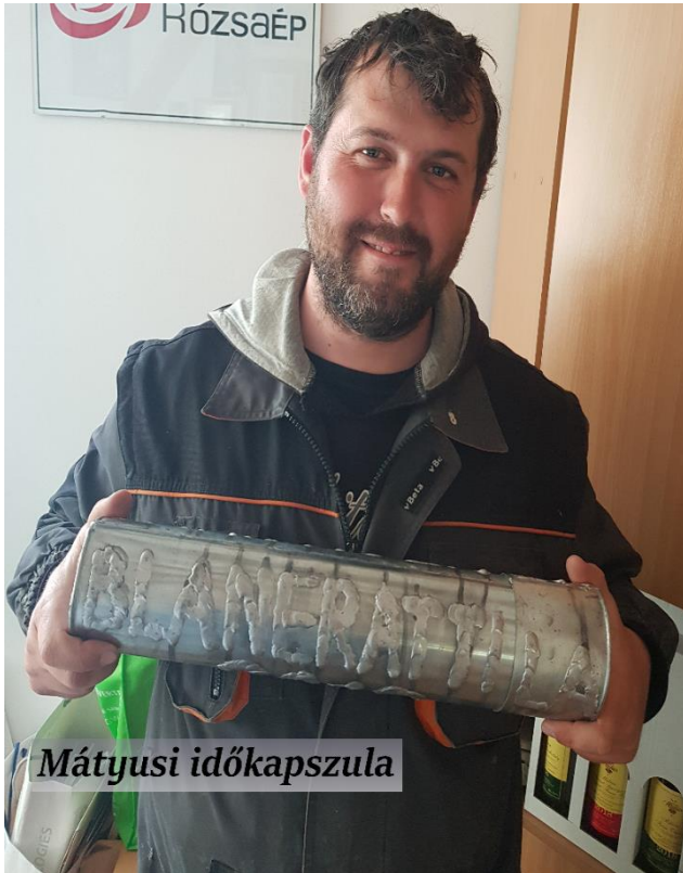
Mátyusi idő kapszula