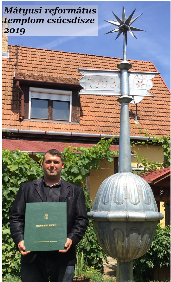
Mátyusi református templom csúcsdíszje 2019