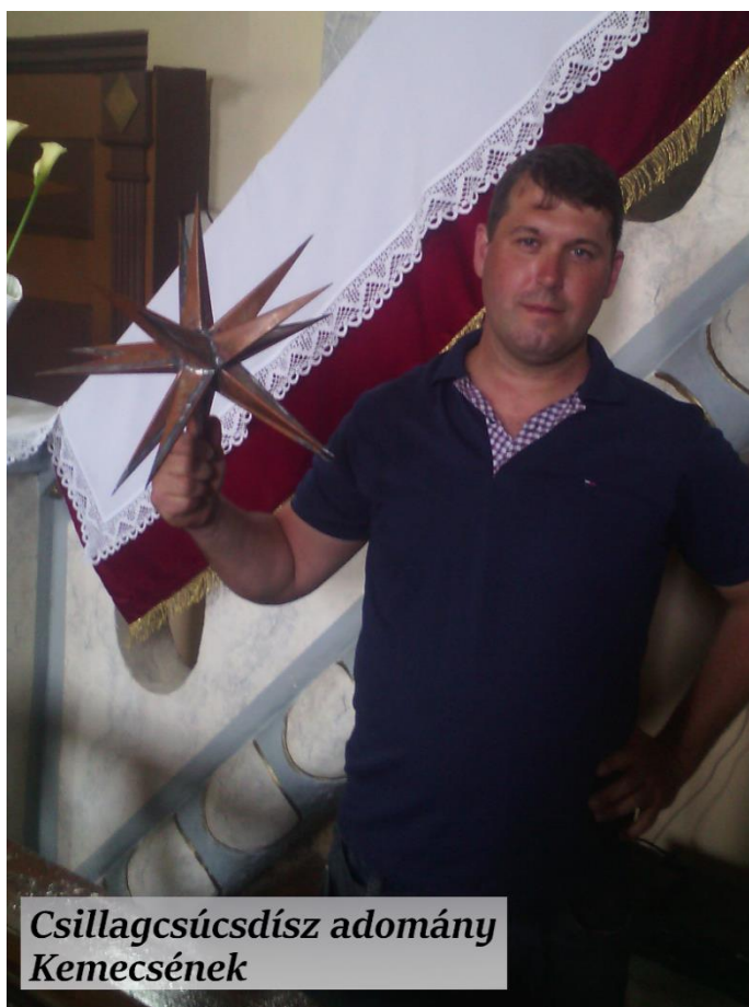
Csillagcsúcsdíszenek adomány Kemecsenek