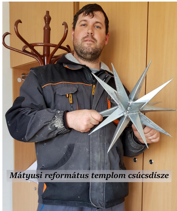
Mátyusi református templom csúcsdísze